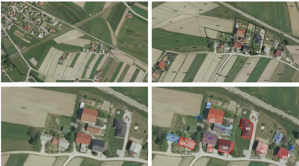
Slika 2: Območje obravnave - širši prikaz in ožje območje; desno spodaj prikaza namenske rabe objektov - rdeče obrobljeni objekti so stanovanjske stavbe.