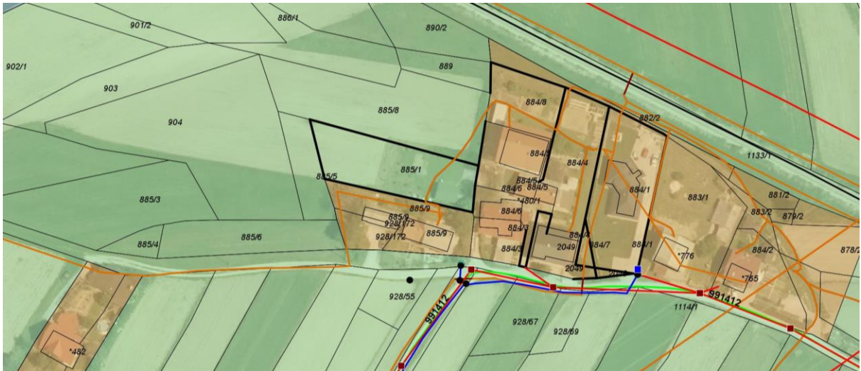
Slika 1: Območje obravnave / rumeno-oranžno = območje stavbnega zemljišča (As), svetlo zelena so kmetijska zemljišča, oranžna linija = telekomunikacijski vodi, modra linija = vodovod, lomljena rdeča linija = javna kanalizacija, ravna rdeča linija = daljnovodi, debele in tanke črne linije = parcelne meje (vir svetovni splet, gis.iObčina.si 2018).