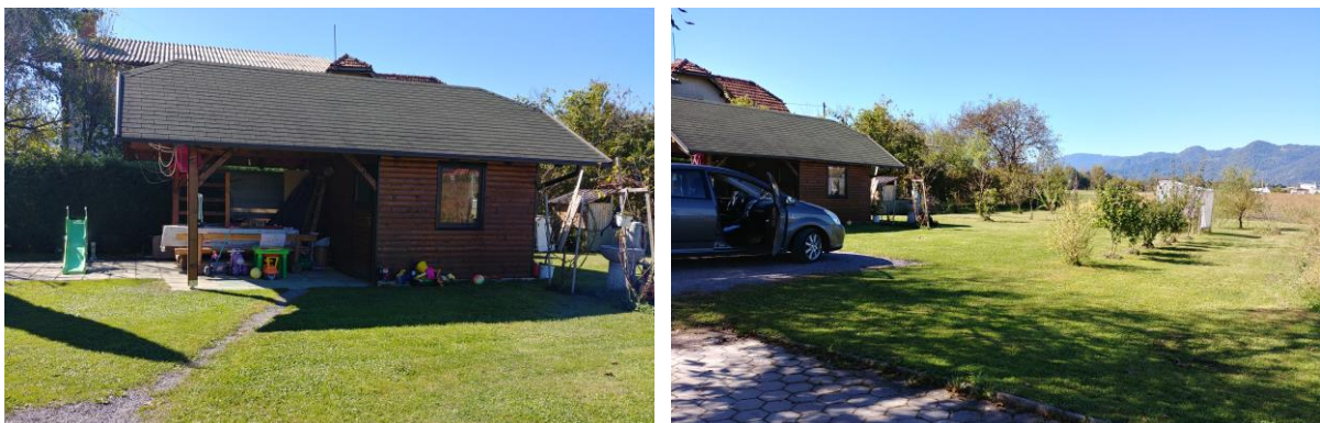
Slika 3: Pogled na obravnavano zemljišče – iz severovzhoda.