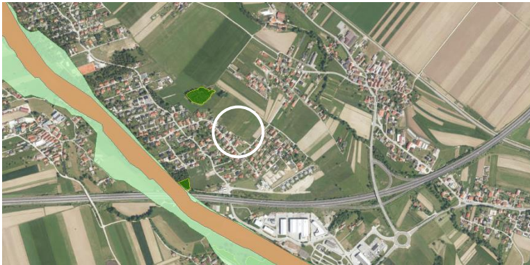
Slika 2: Prikaz območij zavarovane narave - vodotok Savinja, varovani gozd

V cesti potekajo obstoječi komunalni vodi (vodovod, kanalizacijski vod, plinovod in telekomunikacijski vodi). Telekomunikacijski vodi potekajo tudi preko ostalih parcel (246/170, 246/260, 246/169, 246259 in 246/168) ter vzdolž celotnega južnega roba območja.