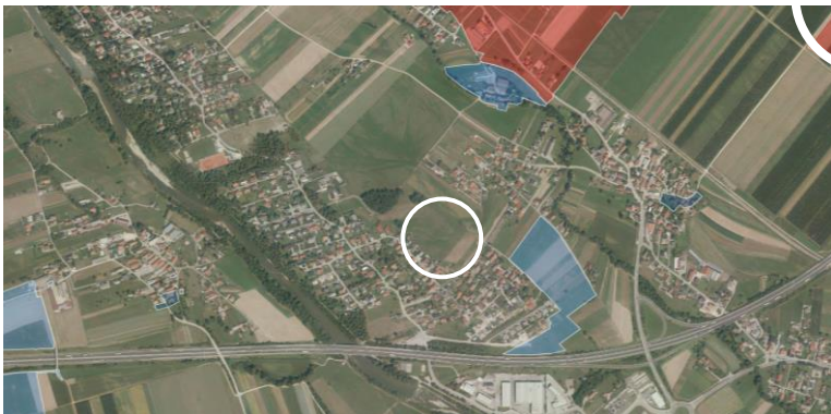
Slika 4: Prikaz območij zavarovane kulturne dediščine (iObcina)