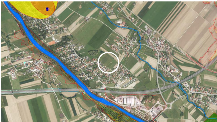
Slika 3: Prikaz območij vodnih virov in njihovih varovanj, vodotokov in poplavnih območij (vir: Atlas okolja)