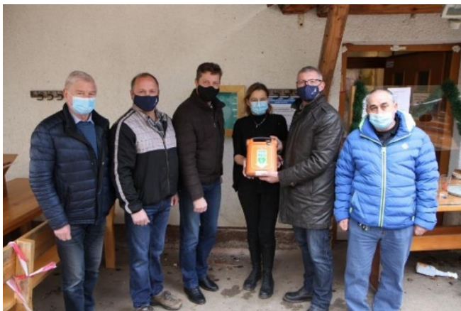
Slika 2: Predaja defibrilatorja v uporabo Planinskemu domu na Gori Oljki