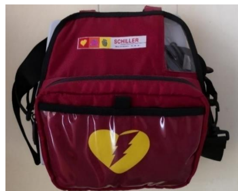
Slika 3: Defibrilator v Domu upokojencev Polzela