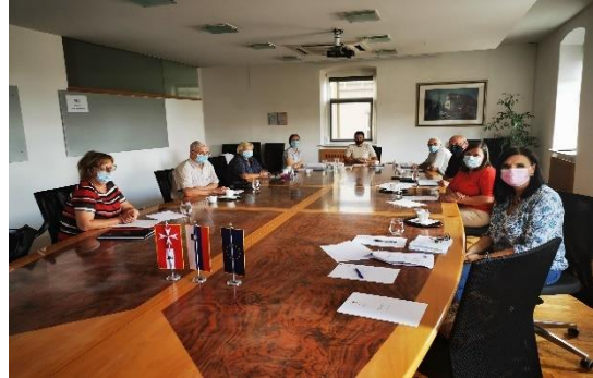
Slika 11: Prvi sestanek