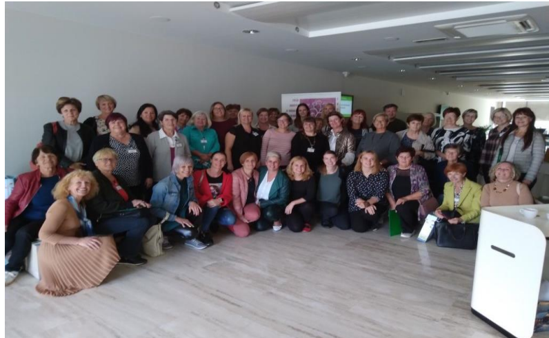
Slike 5: Delavnice in izobraževanja Medgeneracijskega društva Mozaik generacij Polzela