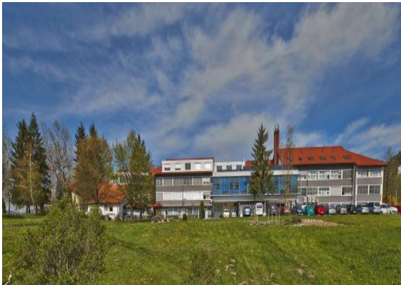
Slika 7: Dom Nine Pokorn Grmovje

Občine imajo na področju socialnega varstva relativno malo pristojnosti pri organizaciji javnih služb, odgovorne pa so za organizacijo in financiranje socialnovarstvene pravice do pomoči družini na domu, ki jo v Občini Polzela zagotavlja Dom Nine Pokorn Grmovje. Trenutno imamo šest varovancev v domu, 37 uporabnikov pomoči na domu ter enega družinskega pomočnika, ki nudi posameznikom osnovno oskrbo, dnevno varstvo in pomoč.