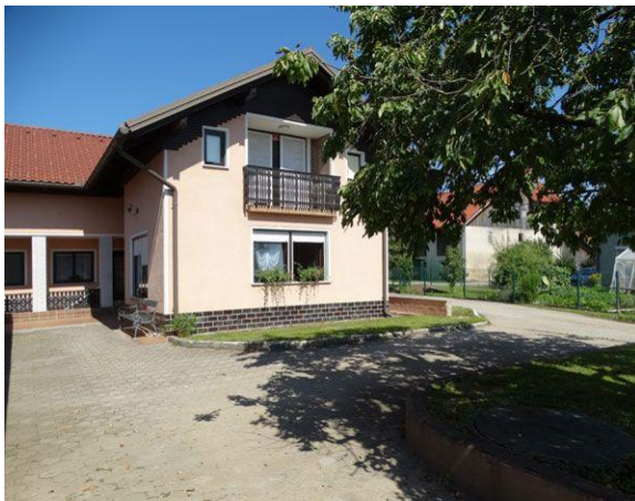
Slika 8: Bivalna enota 7

Občine imajo na področju socialnega varstva relativno malo pristojnosti pri organizaciji javnih služb, odgovorne pa so za organizacijo in financiranje socialnovarstvene pravice do pomoči družini na domu, ki jo v Občini Polzela zagotavlja Dom Nine Pokorn Grmovje. Trenutno imamo šest varovancev v domu, 37 uporabnikov pomoči na domu ter enega družinskega pomočnika, ki nudi posameznikom osnovno oskrbo, dnevno varstvo in pomoč.