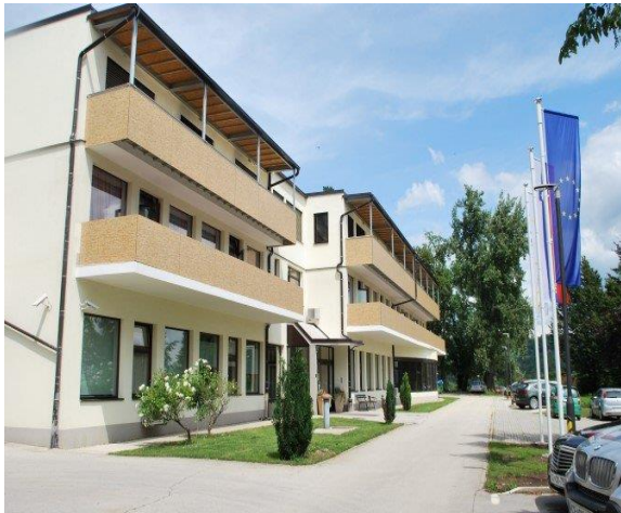
Slika 9: Dom upokojencev Polzela