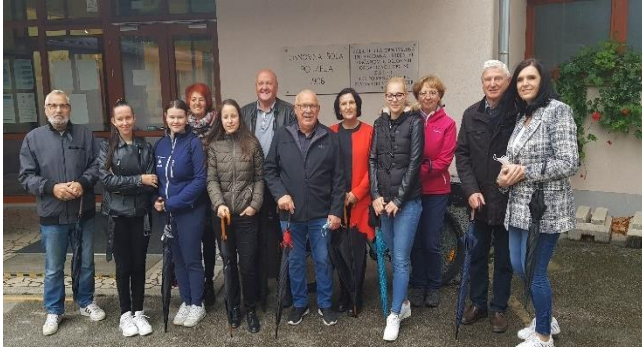
Slika 10: Oglede dejanskega stanja

Svet invalidov, člani delovne skupine, invalidna društva, ki delujejo na območju Občine Polzela, in druga zainteresirana društva so se sestali trikrat na različnih lokacijah ter na podlagi pregleda na terenu pripravili dejansko analizo stanja.