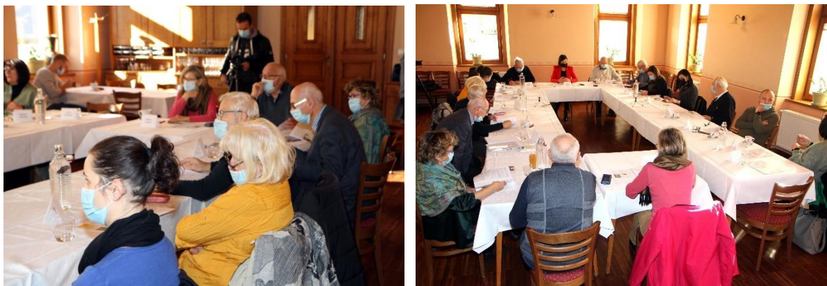
Slika 12: Okrogla miza z dne 7. december 2021

Do zdaj je na nivoju Slovenije listino Občina po meri invalidov prejelo štirideset občin, med spodnesavinjskimi sta to občini Žalec in Prebold. Občina Polzela bo, če bodo aktivnosti potekale skladno s terminskim načrtom, omenjeni naziv prejela ob mednarodnem dnevu invalidov konec prihodnjega leta.