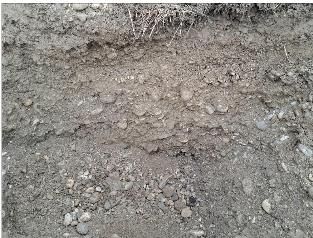
Slika 4: Sondažni izkop

Na podlagi terenskih preiskav in podatkov iz literature so za posamezne sloje podane še nekatere druge geomehanske karakteristike.