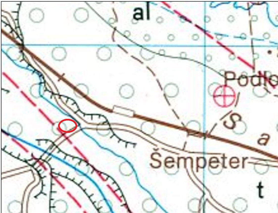
Slika 3: Izsek iz OGK list Celje z označeno lokacijo objekta