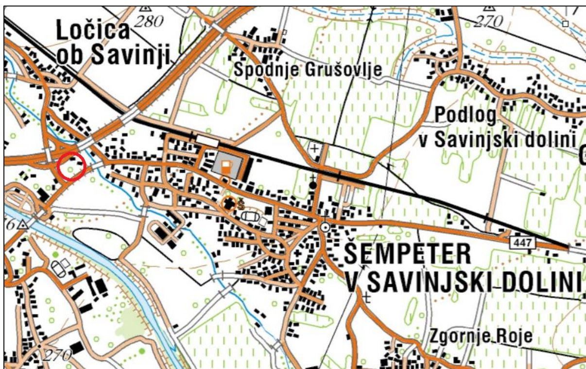
Slika 1: Geografska lokacija parcele predvidene za gradnjo

Območje OPPN na severozahodu meji na mejo Občine Polzela, na severovzhodu na kmetijske površine, na jugovzhodu na regionalno cesto R2-447/0367 ter na zahodu na območje krožnega križišča.