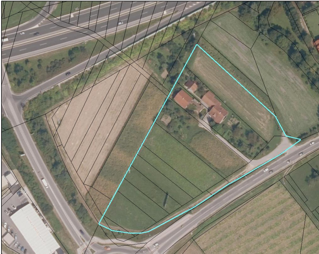
Slika 2: Ortofoto posnetek z označenega območja (vir http://gis.arso.gov.si/atlasokolja )