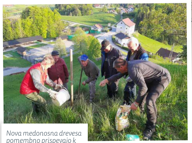
Nova medonosna drevesa pomembno prispevajo k ohranjanju opravevalcev.