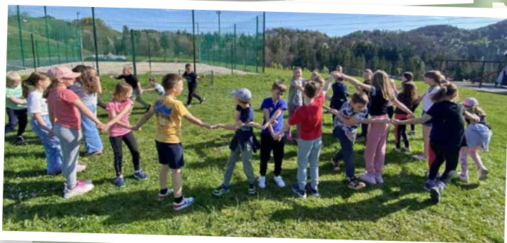
▲ Učenci so se vrnili v preteklost in obujali igre naših babic in dedkov.