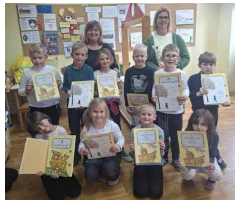
Zlati bralci s spominskimi priznanji in najmlajši bralci s POŠ Andraž nad Polzelo