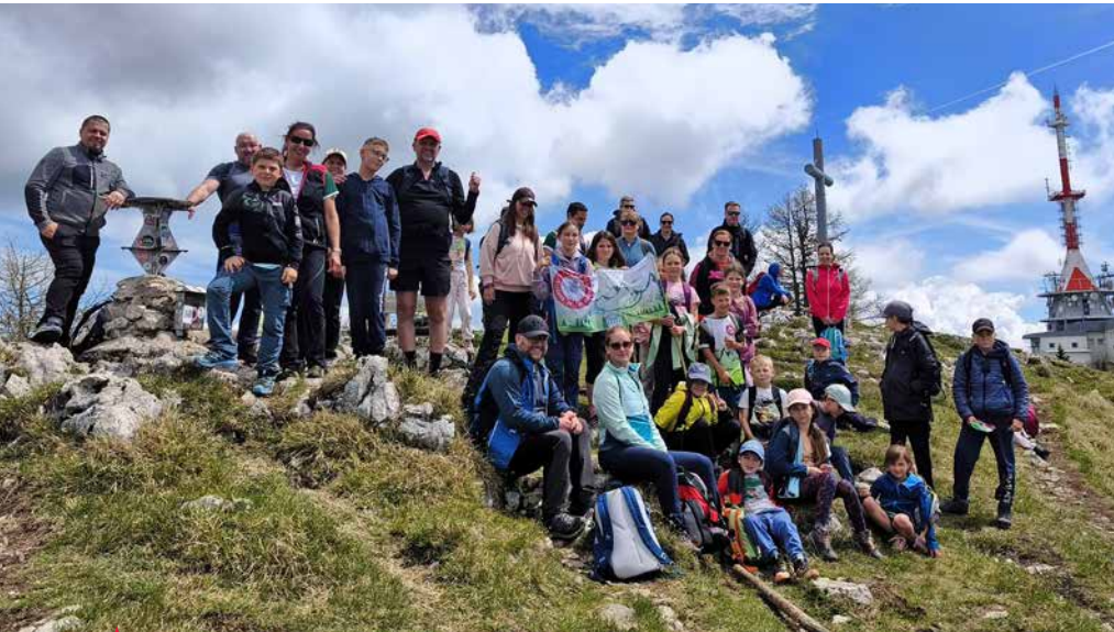
Mladi planinci so skupaj s starši in drugimi pohodniki v sončnem vremenu osvojili Uršljo goro.

V soboto, 9. maja 2026, smo se mladi planinci Osnovne šole Polzela in Planinskega društva Polzela ob 8. uri zjutraj zbrali za Osnovno šolo Polzela, kjer nas je čakal avtobus. Nestrpno smo pričakovali še zadnji pohod v tem šolskem letu.