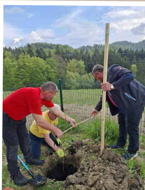
Novozasajene srebrnolistnate lipe bodo v prihodnjih letih obogatile prostor športnega parka in nudile hrano opravevalcem.