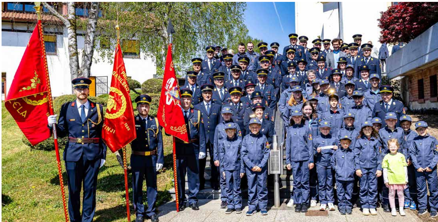
▲ Gasilke in gasilci gasilskega poveljstva Občine Polzela so se prvo majsko nedeljo udeležili maše v čast svojemu zavetniku, svetemu Florjanu.

Prvo majsko nedeljo so se gasilci gasilskega poveljstva Občine Polzela tradicionalno udeležili maše v počastitev svojega zavetnika, svetega Florjana, ki praznuje god 4. maja.