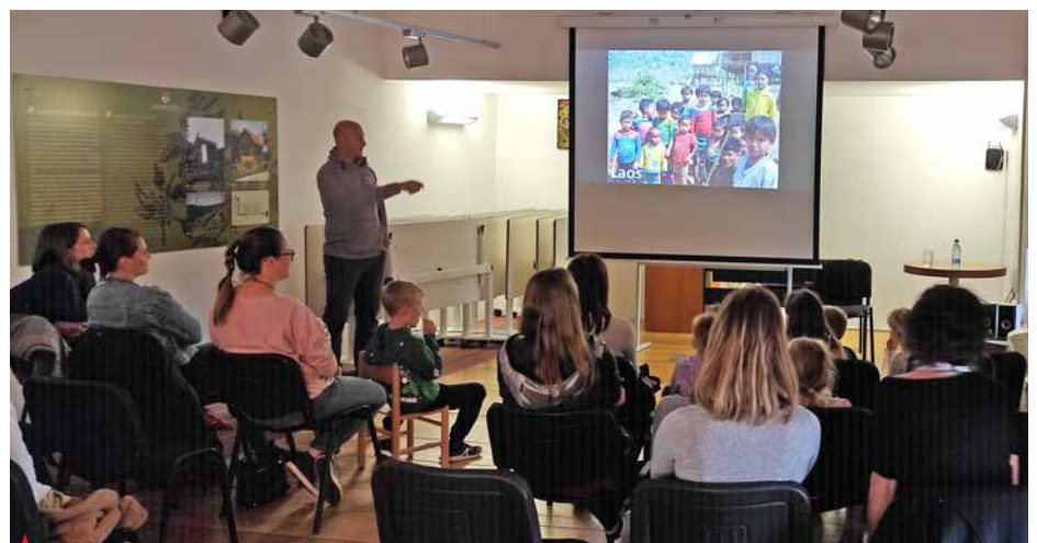
Otroci so ob zanimivem predavanju spoznali, kako različno živijo njihovi vrstniki po svetu.