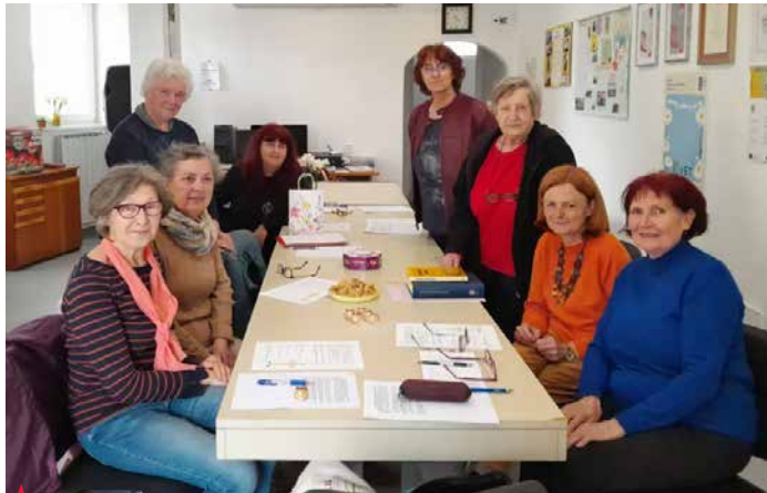
Udeleženke so skozi zanimivo predavanje spoznavale pomen priprave, samozavesti in govornice telesa pri nastopanju.

Predavateljica nas je po srečanju razveselila s prijaznim sporočilom: »Danes je sredo in priznam, da se bom ob sredah še dolgo s hrepenenjem spominjala druženj, ki potekajo tako blizu moje učilnice. Vaših prijaznih obrazov, tople, naklonjene družbe, modrih misli in duhovitih prebliskov, naklonjenega in pristrčnega smeha. Vem, da si bom zaželela vaše umirjene družbe, vrtnarskih in sadjarskih nasvetov ter kave pri Cizej. Izjemno prijetno mi je bilo v vaši družbi. Toplo pozdravljam vse udeleženke. Želim vam, da nadaljujete pristrčna druženja ter širite toplino, humor in toploto modrosti naokoli. Takšna prijetna skupina ni samoumevna, vsaka doda košček prijaznosti in toplino.«