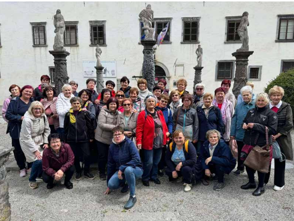
Na izletu so članice ob odkrivanju zanimivosti uživale v sproščenem vzdušju in prijetnem druženju.