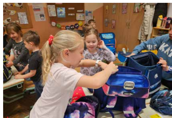
▲ Druženje z bodočimi prvošolci

Tokrat so naši učenci prevzeli vlogo učiteljev in otrokom iz vrtca pomagali pri reševanju njihovega prvega šolskega učnega lista. Naloge so bile zabavne, poučne, likovno obarvane in matematično nagajive. Skupaj smo si ogledali tudi šolsko torbo, prebrali pravljico in peli, za konec pa smo se še malo poigrali. Nasmejani obrazi so bili dokaz, da smo vsi uživali v druženju. Prvošolci so zapisali tudi nekaj svojih vtisov o srečanju. Bilo nam je lepo.