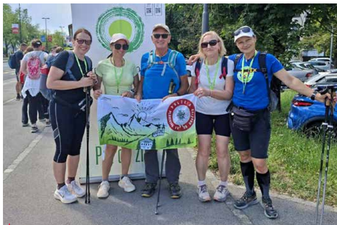
▲ Planinci so uspešno prehodili znamenito Pot spominov in tovarštva okoli Ljubljane.