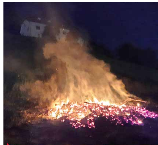
Pri Športnem parku Lipa je tudi letos zagorel simbolični kres ob prazniku dela.

Prvomajski kresovi izvirajo iz starih pomladnih običajev, ko so ljudje z ognjem simbolično odganjali zimo in pozdravljali приход pomladi. Kasneje so kresovi postali tudi simbol praznika dela, povezanosti in delavske solidarnosti.