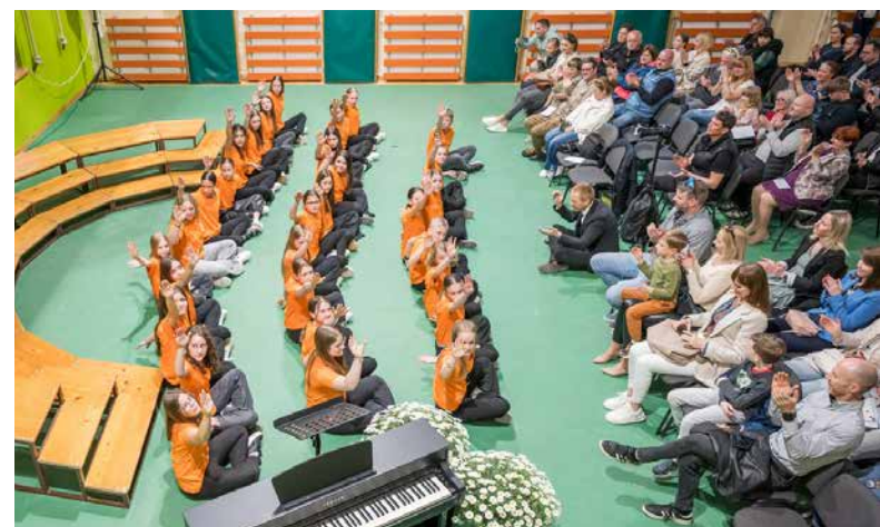
Sončki, Polžki in MPZ OŠ Polzela na reviji pevskih zborov Pozdrav pomladi v Taboru