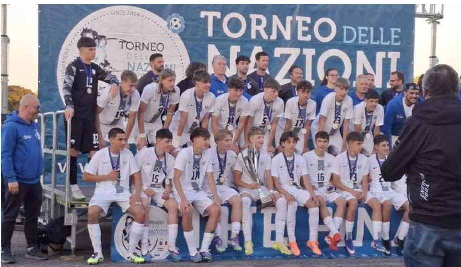
▲ Slovenska reprezentanca U15 je Turnir narodov končala brez poraza in z osvojitvijo prvega mesta poskrbela za nov pomemben uspeh slovenskega mladinskega nogometa.