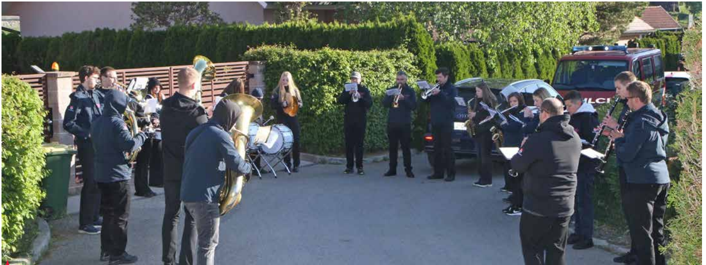
Med nastopom Pihalnega orkestra Cecilija v naselju novih hiš v Založah