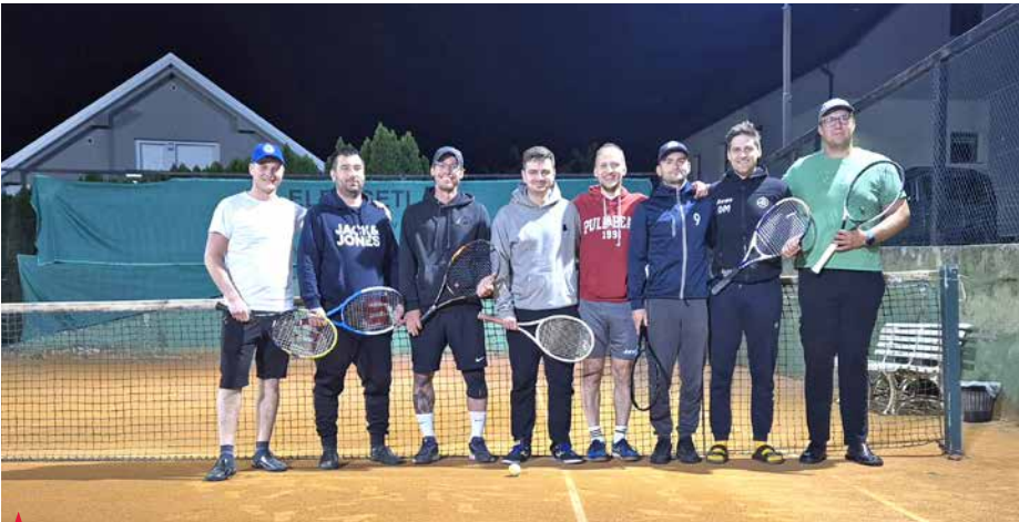
▲ Udeleženci turnirja

Športno društvo Andraž je ob praznovanju letošnjih prvomajskih praznikov organiziralo otvoritveni turnir tenisa za svoje članice in člane. Na razpis se je prijaviło osem članov.