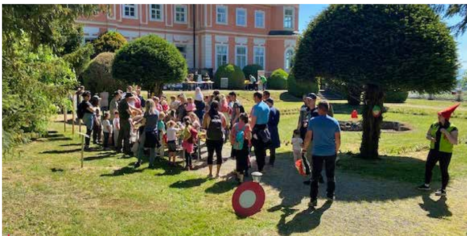
▲ Utrinki z letošnjega Škratovega pohoda