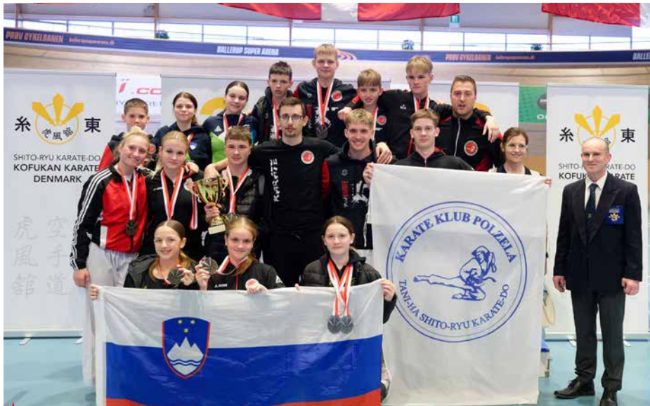
▲ Ponosni predstavniki najuspešnejše države na "Kofukan International Cup" na Danskem, kjer so dosegli vrhunski uspeh.