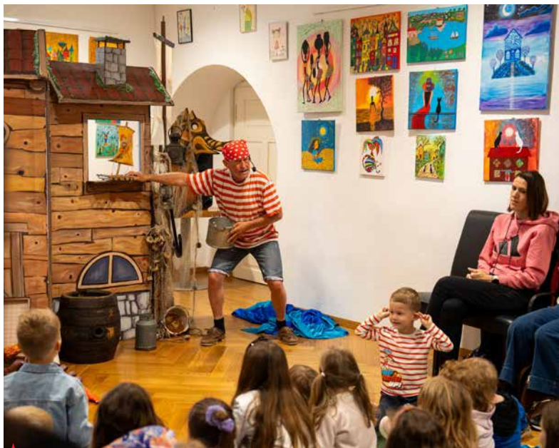
▲ Mladi obiskovalci so po predstavi Gusar Berto na gradu Komenda z navdušenjem iskali skriti gusarski zaklad.

Avla gradu Komenda je bila ob obisku številnih družin skoraj premajhna za vse obiskovalce, kar je še en dokaz, kako pomemb-