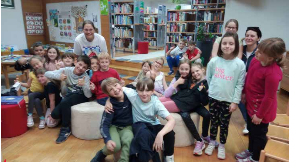
Učenci so si z zanimanjem ogledali knjižnico ter spoznavali njeno zgodovino in pomen za kraj.